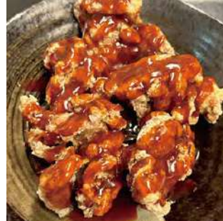
唐揚げ-ヤンニョム fried chicken yangnyeom