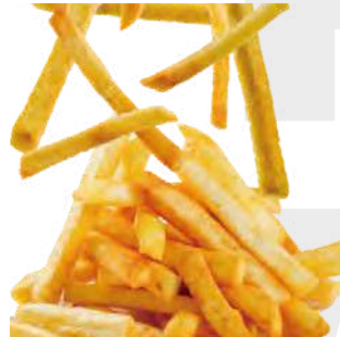
フライドポテト french fries