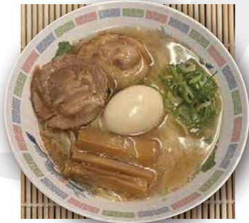
ホタテ香る 塩ラーメン 味玉のせ scallop salt ramen flavored egg