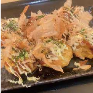
ソースたこ焼き sauce takoyaki