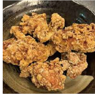
唐揚げ-プレーン fried chicken plane