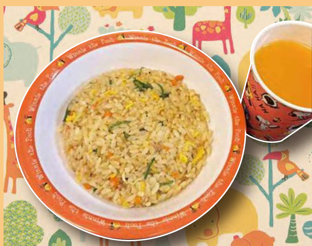
おこさまチャーハン