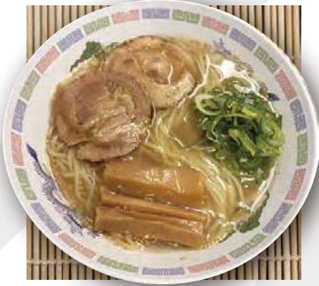
ホタテ香る 塩ラーメン scallop salt ramen