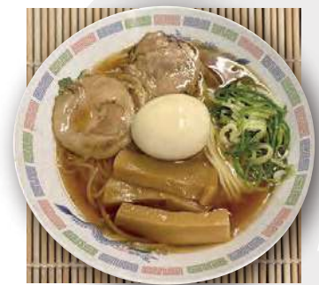
東京醤油ラーメン 味玉のせ soy sauce ramen flavored egg