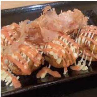
めんたいマヨたこ焼き mentai mayonnaise takoyaki