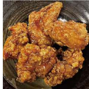
唐揚げ-たれ漬け fried chicken marinated sauce