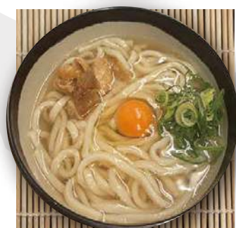
かすうどん 生卵のせ kasu udon topped raw egg