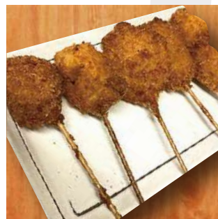
串カツ5種盛り assortment 5type kushikatsu