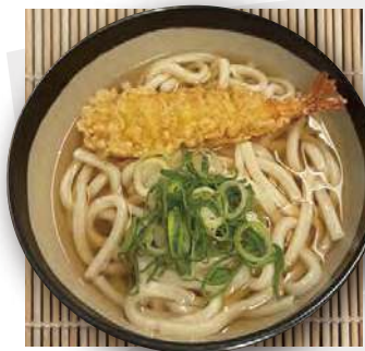
天ぷらうどん tempura udon