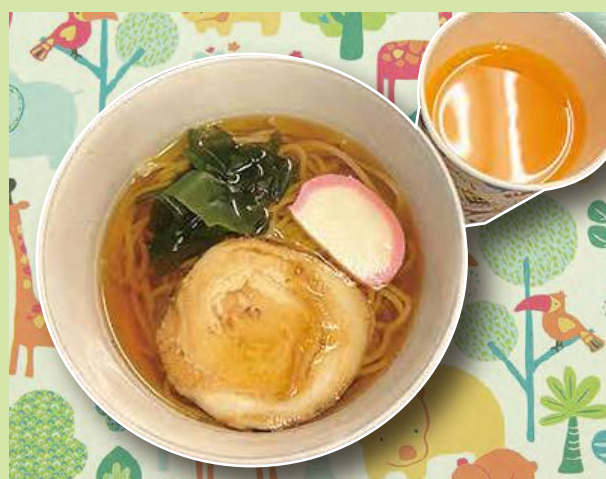
おこさまラーメン