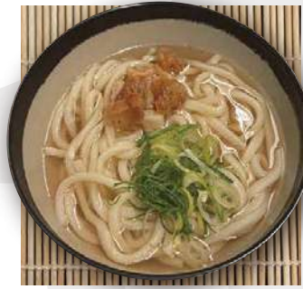
かすうどん kasu udon