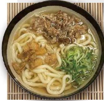
かすうどん 牛肉のせ kasu udon topped beef