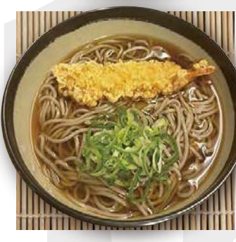
天ぷらそば tempura soba