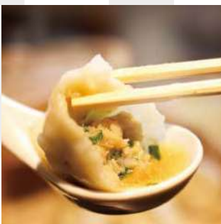
小籠包 xiao long bao