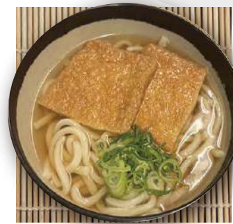
きつねうどん kitsune udon