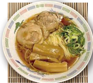
東京醤油ラーメン soy sauce ramen