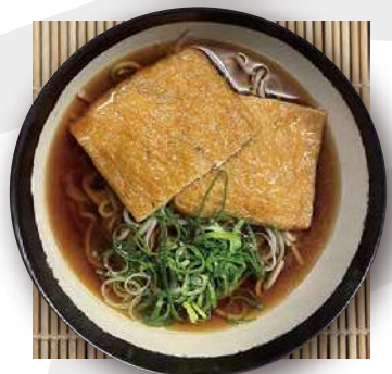
たぬきそば tanuki soba