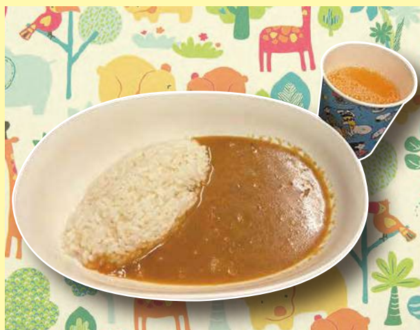
おこさまカレーライス