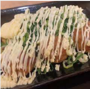
ねぎ塩たこ焼き negi shio takoyaki